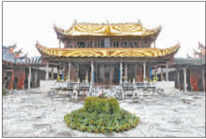
永州文庙