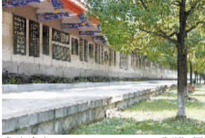
常德诗墙