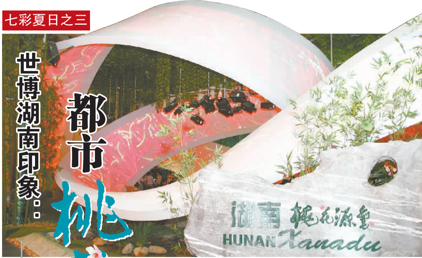
湖南主题馆“桃花源里”