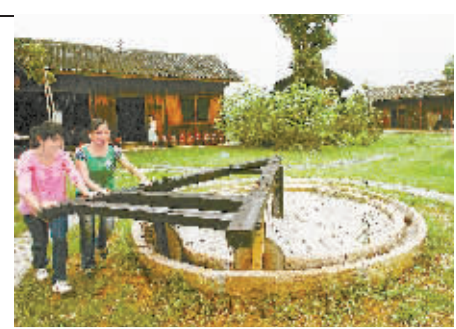
7月25日，游客在常德市柳叶湖景区感受“渔樵文化”。该市在旅游开发中发挥湖区的资源和文化优势，吸引了众多游客。