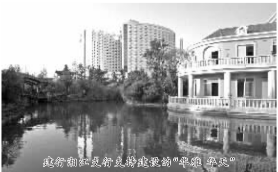
建行湘江支行支持建设的“华雅·华天”

从荒草坡地到鳞次栉比的亮丽楼盘,从滩涂泽地到通畅的路网和休闲公园,从各大经济园区,到各个商业小区……建行员工的脚印踏遍了长沙每一个角落,他们默默无闻地帮助“星城”人们筑着爱的港湾和事业的摩天大厦,也终于换来了一片片住宅的亮相,一栋栋厂房校舍和写字楼的崛起,一条条道路的豪迈延展和一个经济群落的兴盛繁荣……10年如一日,建行湘江支行在自己的幕后建设者之路上愈行愈远,而古城长沙人,也离自己的山水洲城之梦、安居乐业之梦,越来越近。