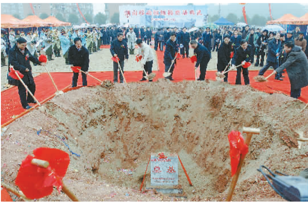
为适应现代通信技术要求,湖南移动斥资在长沙车站北路新建通信指挥调度、应急通信保障、新业务研发等多功能于一体的现代通讯大楼,工程建筑面积6万平方米。图为12月30日,湖南移动枢纽楼奠基典礼现场。

活施教,分层推进;同时创新小专业品牌,从高一到高三,对学生的身体、心理、生活等方面,派专业老师采用人盯人战略,个别辅导。他们还整合各方德育教育资源,探索出了“家校联合、警校联防、商校联手”的“三联德育网络”模式。经过10年卧薪尝胆,发奋图强,湘阴五中彻底摘掉了“薄弱高中”的帽子。近3年,有174名美术、音乐、体育生升入大学,小专业二本上线人数约占全县近二分之一。