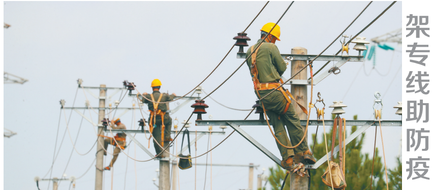
架专线助防疫 8月12日，新田县龙泉街道扒田丘村，电力工人冒着高温在架设线路。连日来，该县为县人民医院架设供电专线，确保疫情防控期间供电安全。