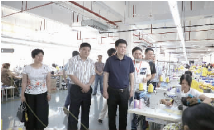
县领导走访产业项目。

规划编制的机遇,积极开展专题调研座谈,科学谋划储备了640余个产业项目,总投资近500亿元,其中超10亿元重大项目12个。