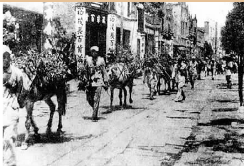
1949年8月5日,中国人民解放军第四野战军第十二兵团的先头部队渡过浏阳河,从小吴门开进长沙城。

8月4日,《湖南和平起义通电》发表,程潜、陈明仁率部投入人民怀抱。5日,解放军进入长沙城。那天,红旗漫天招展,古城重归人民的怀抱,湖南70年和平发展的奋进史就此开启。