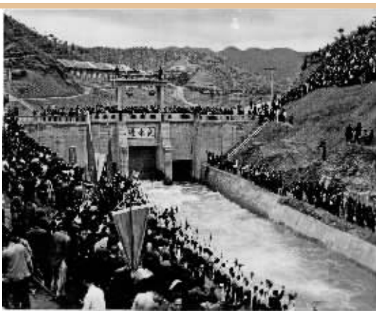
1966年6月2日,韶山灌区进水闸两旁人声鼎沸,许多群众从四面八方赶来欢庆渠道通水。

解放前夕,湘西匪患尤烈。解放后,国民党反动派据山区天险建反共根据地,人数达10余万,百姓深受其害。1949年-1952年,解放军进湘西剿匪。山高林密,但军民一心,号角声声,武陵深处,数百年匪患宣告终结。