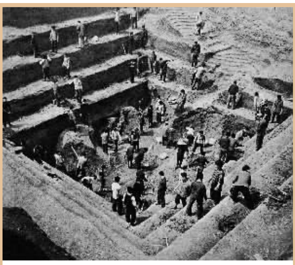
各校学生支援马王堆汉墓发掘工作。

冷战时期,美国高空侦察机频频侵入我国领空。1967年7月以后,我军装备自主研发的导弹系统发射“红旗二号”导弹击落多架U2侦察机,从此U2不敢踏足大陆。包括彭海蛟在内的一批湖南籍研究人员,一路见证了“红旗二号”的成功。