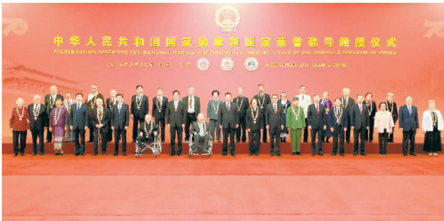
上图:9月29日,中华人民共和国国家勋章和国家荣誉称号颁授仪式在北京人民大会堂金色大厅隆重举行。习近平等党和国家领导人同国家勋章和国家荣誉称号获得者合影。