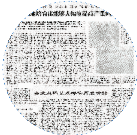
1976年12月16日对袁隆平和杂交水稻的整版报道，这是湖南日报第一篇详细介绍杂交水稻研究的报道。