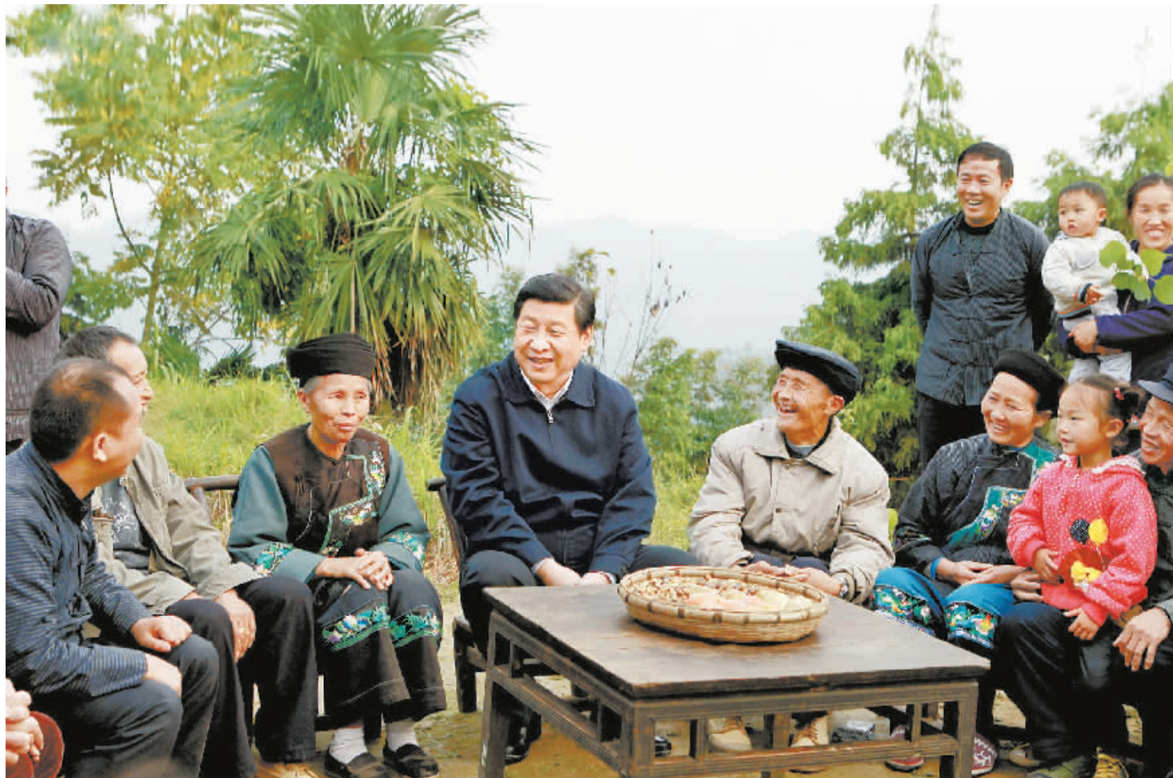
2013年11月3日，习近平总书记在湘西土家族苗族自治州花垣县双龙镇十八洞村同村民座谈。

“铿锵有力，太及时、太解渴了！”2018年，《湖南日报》连续推出的“深入学习贯彻习近平总书记对湖南工作的重要指示精神”系列社论，成为全省党员干部的学习读本，网络总阅读量超过千万。“牢记嘱托，我们唯有以实干实绩回报总书记的关怀厚爱。”网友如是留言。