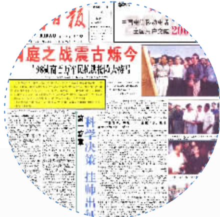
1998年8月18日，头版，《洞庭之战震古烁今》。