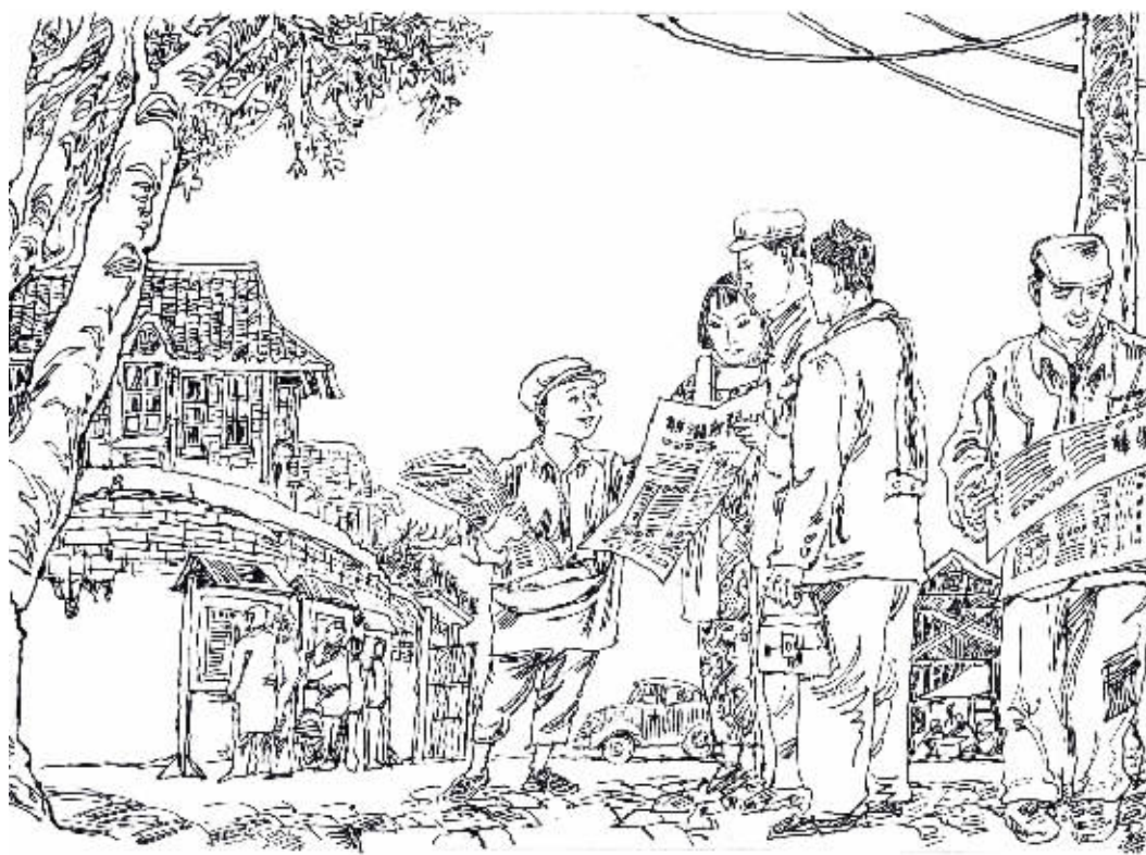
新湖南报社门外报童卖报情景。画/刘谦