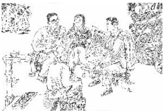
新湖南报记者在菜市场采访。画/刘谦