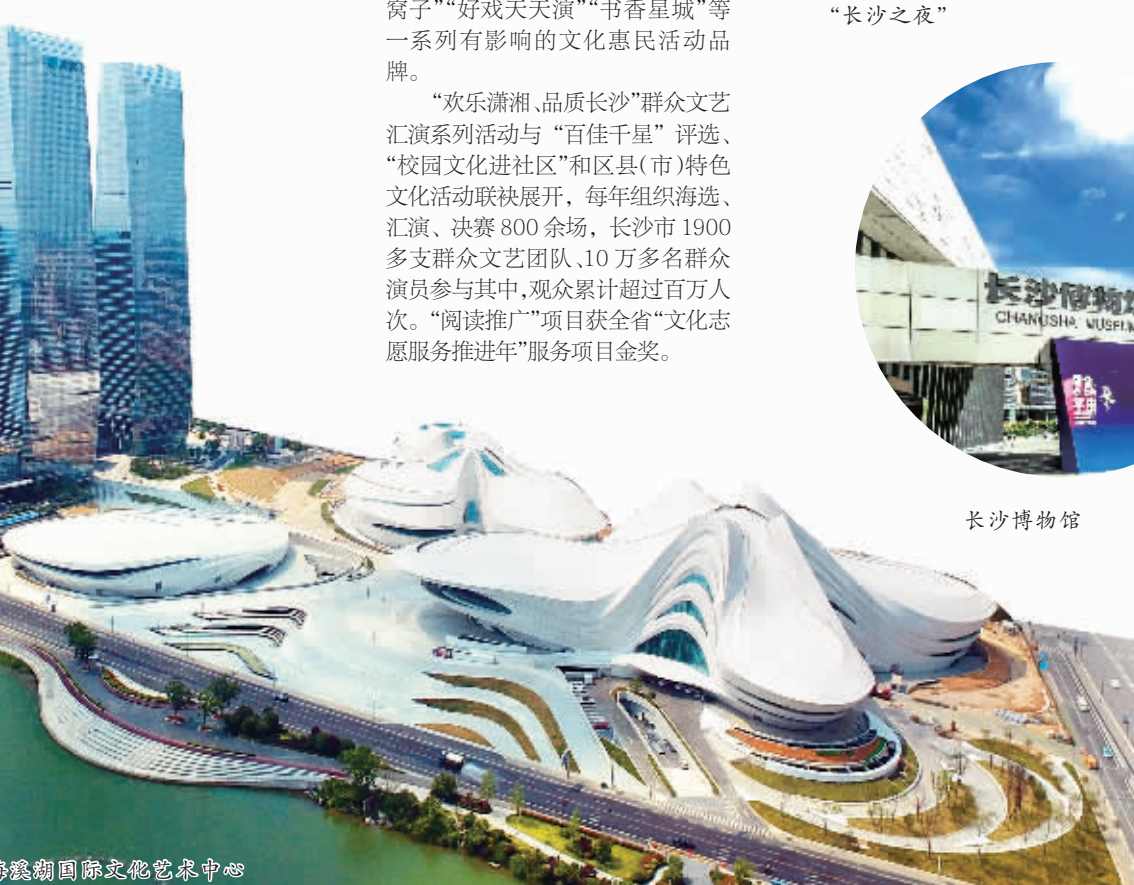
梅溪湖国际文化艺术中心

从文化旅游融合入手，推进文旅综合体项目建设，进一步打造文化旅游新地标、新品牌。炭河古城2017年7月3日开园，新华联铜官窑古镇2018年8月28日开园，华谊兄弟电影小镇2018年9月29日开园运营，美丽中国文化产业示范园一期项目—长沙方特东方神画今年7月开园运营。湘江欢乐城、华强方特东方神画、恒大童世界等项目有序推进。浔龙河特色文化产业小镇获