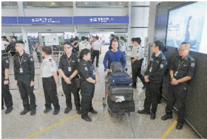
8月14日，在香港国际机场，旅客经安保人员检查后进入机场。

害和恶劣的暴力犯罪行为，是对新闻工作者正当权益的漠视和侵害，是对全球新闻界的挑战和侮辱，是对新闻自由的严重践踏。中国记协强烈呼吁有关方面对侵害新闻工作者人身安全和新闻报道权益的违法行为给予依法严惩，尽快将违法犯罪分子绳之以法。