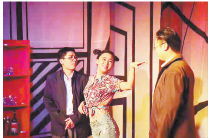
史雅欣《国王的宵夜》剧照。