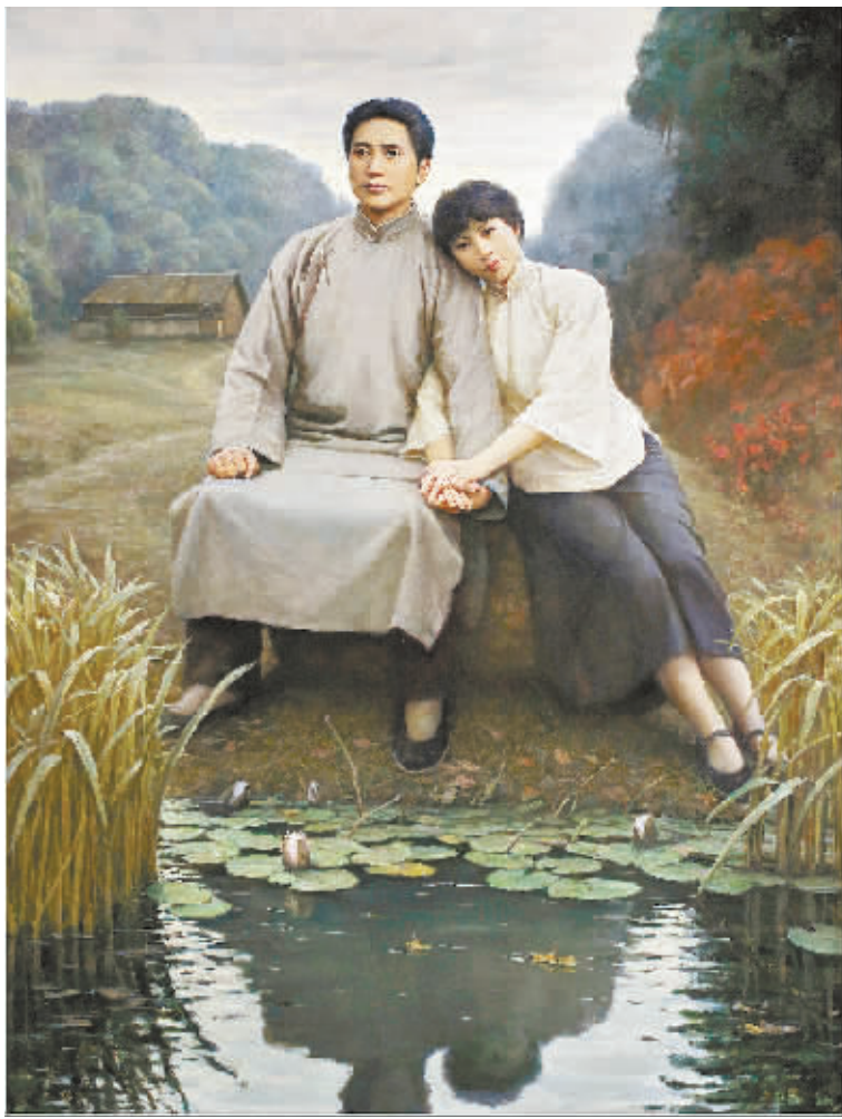
《清水塘畔》李自健 作