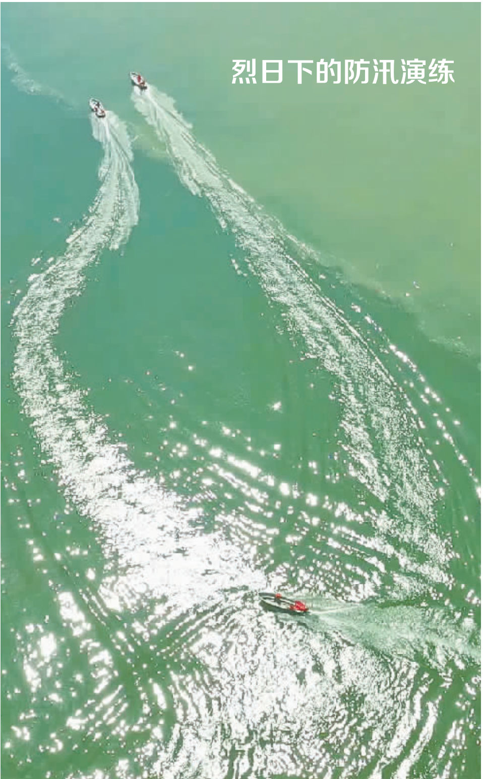
烈日下的防汛演练

暮云进城、融城这几年,不仅改变了当地百姓的生活方式,更带给了他们新的理念和新的希望。