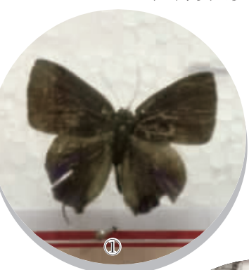
图①李贻耀发现的蝶类新种——东安燕灰蝶。

2002年东安县一中60周年校庆,李贻耀、周秋英把他们制作的5000多件蝴蝶标本,全部无偿捐给学校,建立湖南省首家用于中学生物教学与科研的蝴蝶馆——东安