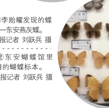
图②东安蝴蝶馆里色彩斑斓的蝴蝶标本。