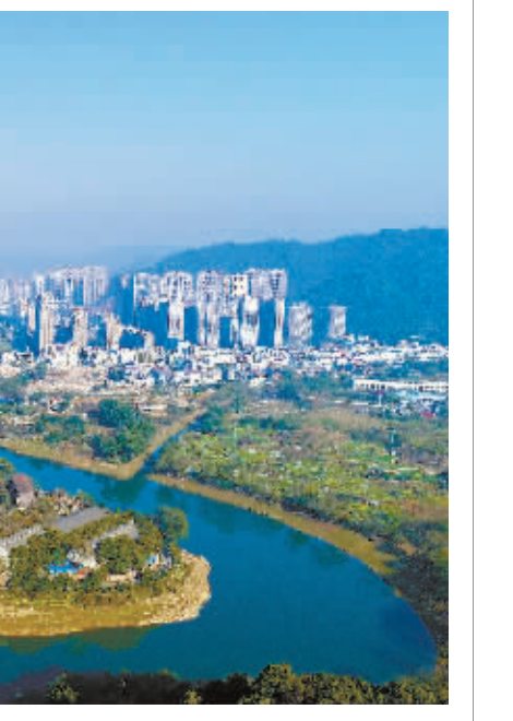
右图：12月17日，浏阳河城区段，水清岸绿，高楼林立。邓霖林 摄

阳市通过优化烟花产业，改善产业布局，打造产业园区等举措加快区域经济发展，生产总值从1978年的2.79亿元增长到2017年的1365.1亿元，实现了从“国家级贫困县”到“全国百强县市”的华丽蝶变，形成了县域经济发展的“浏阳现象”。