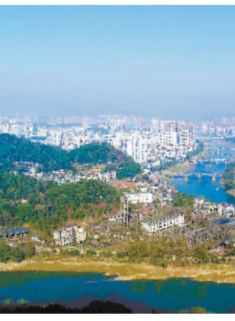
右图：12月17日，浏阳河城区段，水清岸绿，高楼林立。邓霖林 摄

得显著成效。1997年，浏阳市顺利摘掉贫困县帽子。2006年，首次跨入全国百强县市行列，位列第92位。此后，在全国百强县市榜上不断向前迈进。12月16日，中郡研究所《2018县域经济与县域发展监测评价报告》公布，浏阳市排名13位。40年来，浏