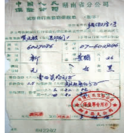
1983年,中国人民保险公司湖南省分公司签下的城市自行车盗窃保险单。