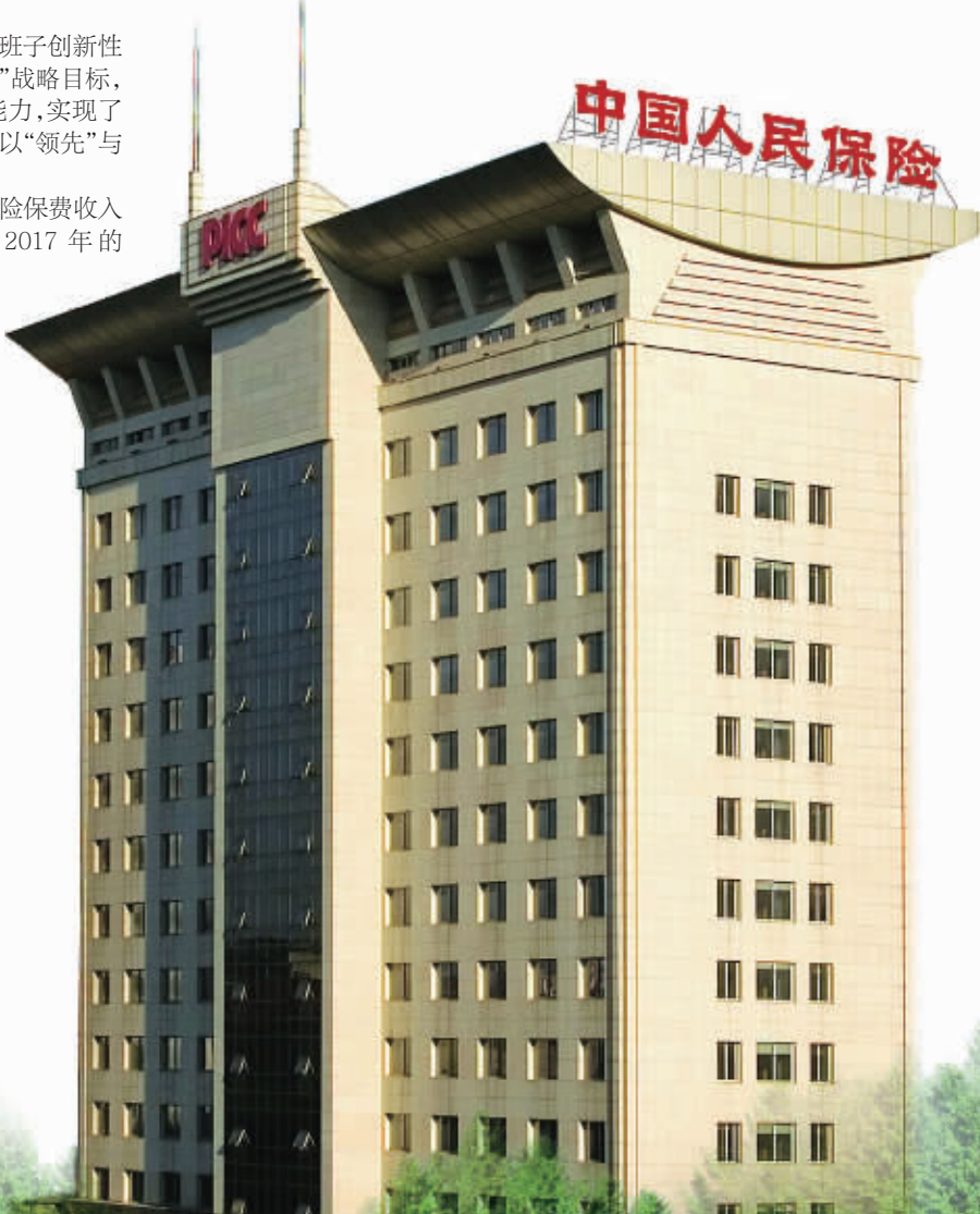
中国人保财险湖南省分公司办公大楼。