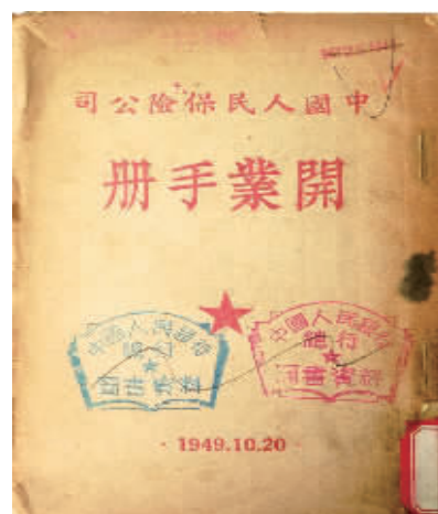
1949年10月20日,中国人民保险公司开业手册。