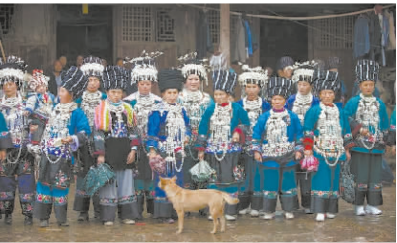
苗族银饰的种类较多,从头到脚,无处不饰。

外地人湘西凤凰古城旅游,都会买上几件苗族银饰作为礼品送给自己的亲朋好友。新政策下的凤凰县禾库镇德榜村日新月异,银饰基地示范点的落成,将为德榜村银饰的发展翻开新的一页,银饰艺人们将继续秉持“工匠精神”,开创新的传承之路。