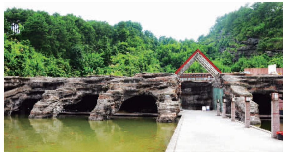
巧具匠心的崑山地质博物馆。

每年的10月16日,是瑶族传统的“盘王节”,当天到瑶寨的客人都会受到最热情的款待,享受最尊贵的瑶王宴席,后来瑶王宴席发展成广受游客青睐的崑山“瑶王宴”。在“瑶王宴”上,你不但能张开味蕾饱餐崑山特有的蕨巴粉、高山竹笋、柴火腊肉、猪血丸子等十二道特色佳肴,还能一边喝着特色米酒,一边在熊熊燃烧的篝火旁与美丽多情的瑶家姑娘们一起,体验竹竿舞、兔子舞等民族舞蹈,在嗨翻全场的热烈气氛中尽情狂欢。