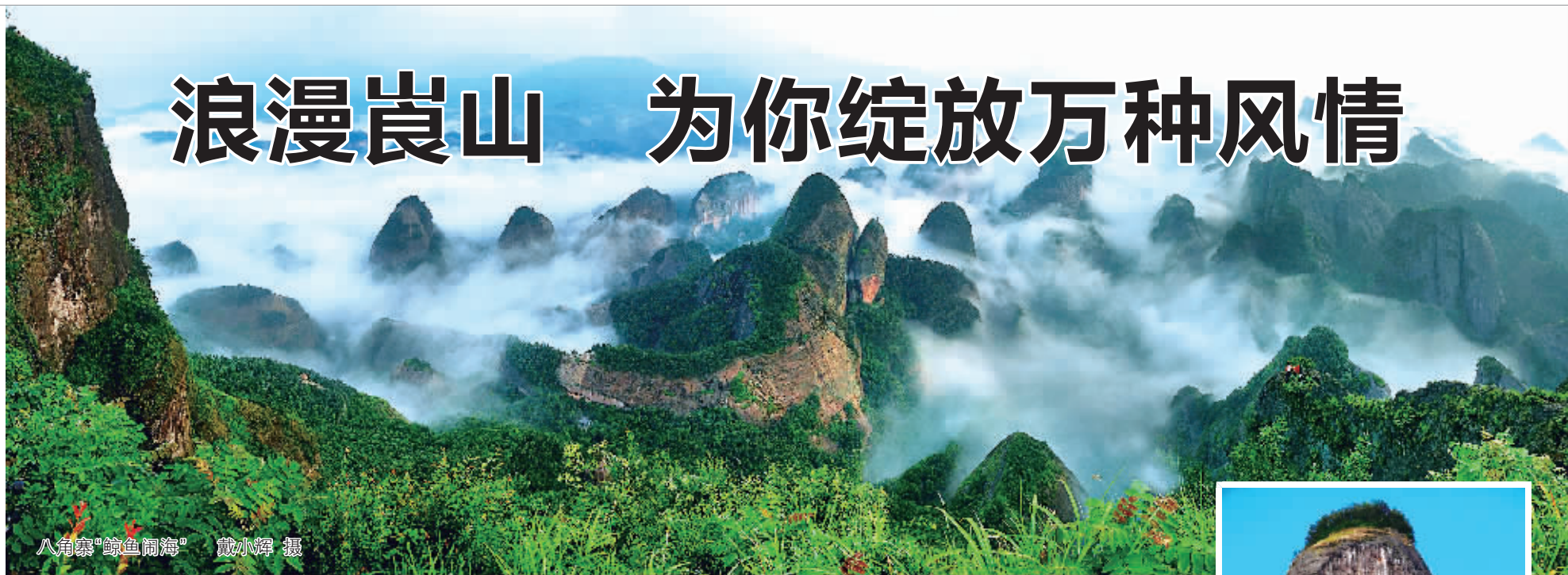
八角寨“鲸鱼闹海”