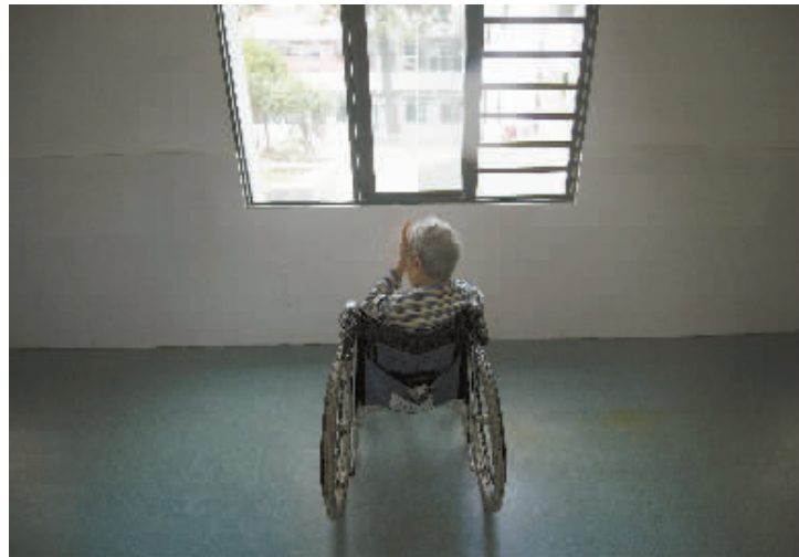
9月18日下午,88岁王奶奶坐在窗户外发呆。她喜欢一个人坐着,有时一句话也不说,有时絮絮叨叨。