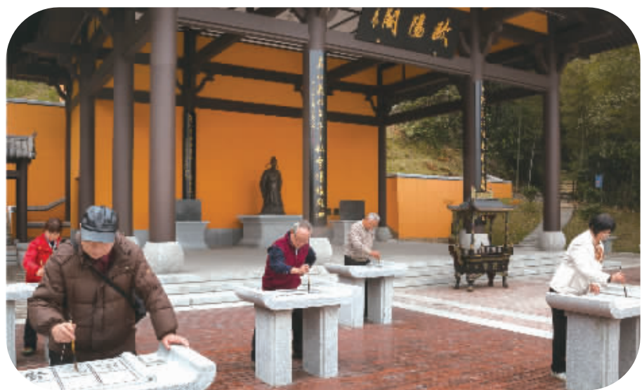
每天,都有书法爱好者来到欧阳询文化园的欧阳阁峙前练习书法。

在中华传统文化的深厚积淀之上,书堂山欧阳询文化园正发展成为集观光游览、书法研修、艺术品交易展览、生态休闲于一体的综合性文化艺术主题公园,书堂山也将朝着“中国书法新圣地,湖湘文化新典范,文化旅游新品牌”的目标大步迈进。