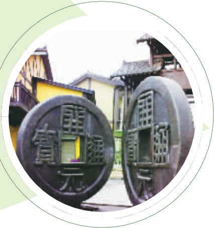
书堂小镇上仿照唐代“开元通宝”钱币铸造的雕塑。