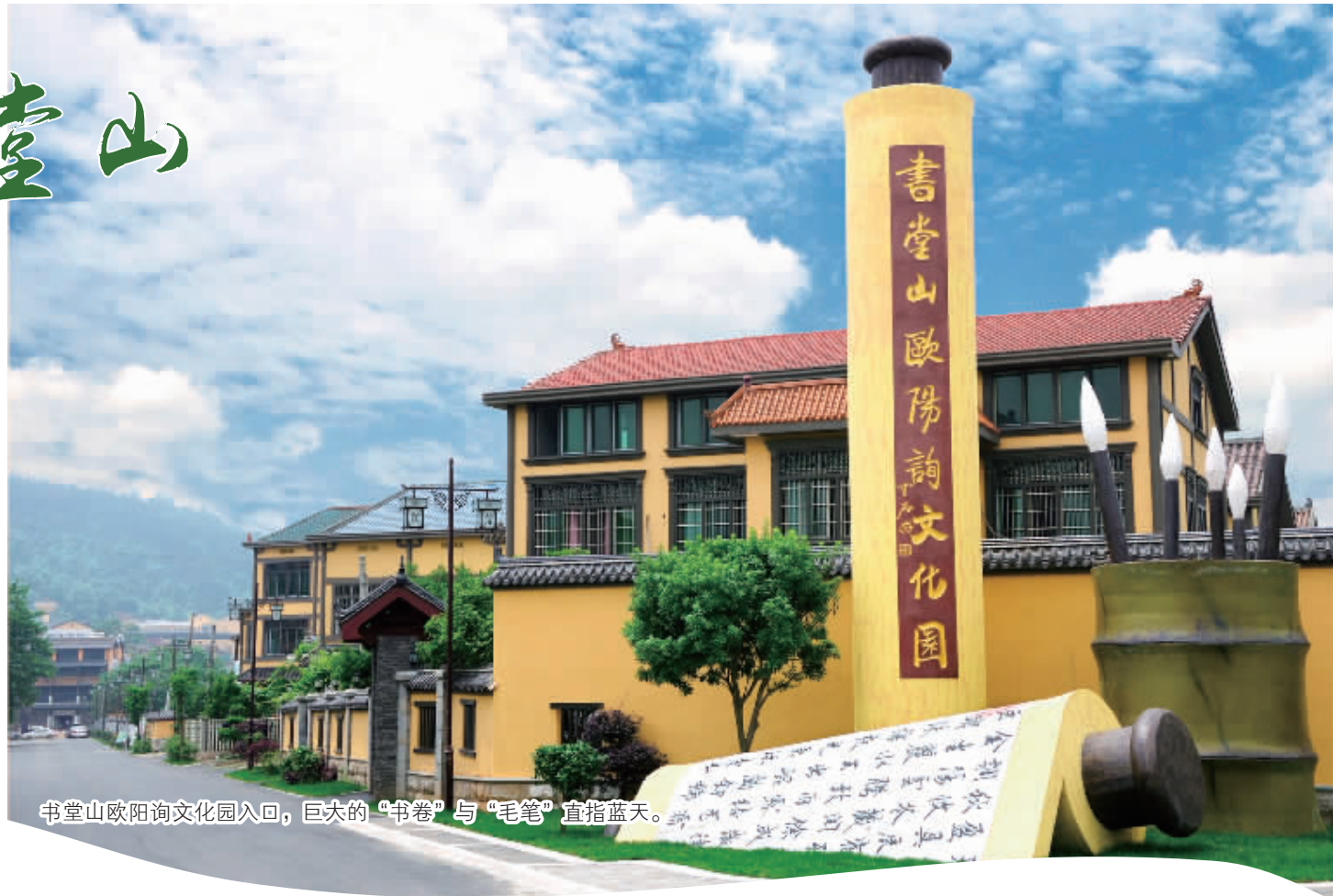
书堂山欧阳询文化园入口,巨大的“书卷”与“毛笔”直指蓝天。