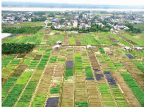
长沙市天心区南托街道沿江村蔬菜种植基地。