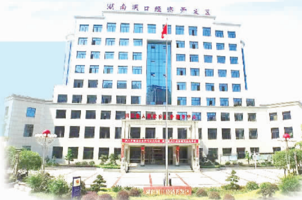
洞口经济开发区综合服务大楼