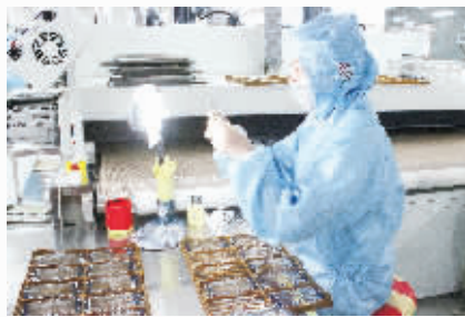
为百科技公司生产车间

高速优质的建设速度，促进洞口经济开发区承载力得到显著提升，逐渐成为邵阳市最具活力的工业集中区之一。