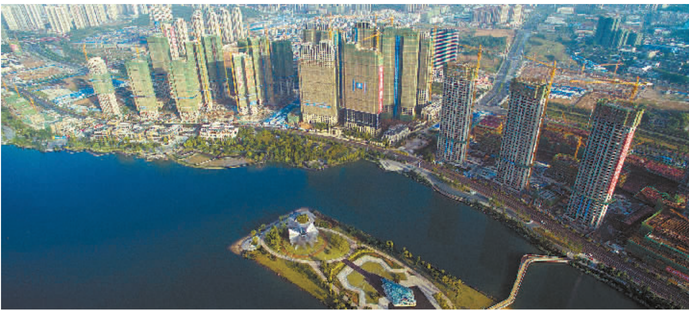
5月12日,长沙市湘江新区的中心城区梅溪湖。