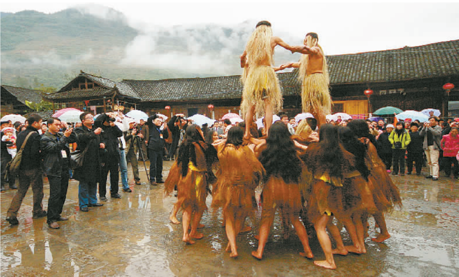
洗车河土家族茅古斯,充满神秘。