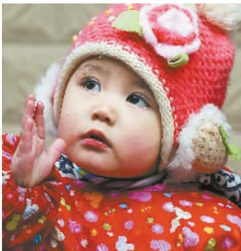
可爱的土家族小姑娘。