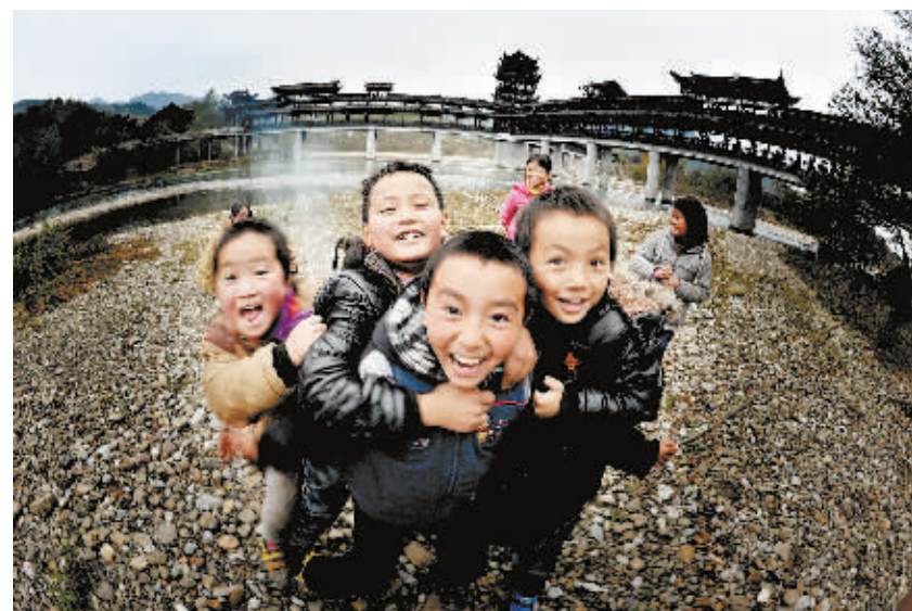
洗车河苗儿滩古镇,天真的少年。