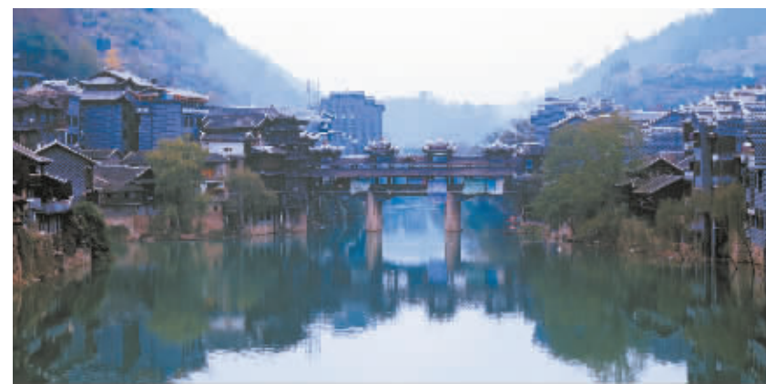
洗车河古镇凉亭桥。