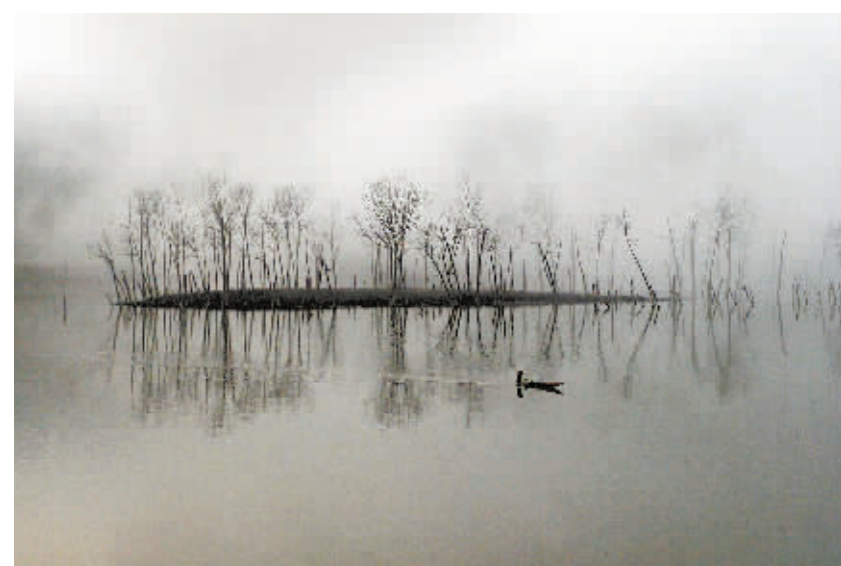
清晨,雾中的里耶百水犹如水墨画卷。