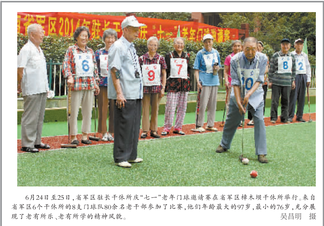
6月24日至25日,省军区驻干休所庆“七一”老年门球邀请赛在省军区樟木坝干休所举行。来自省军区6个干休所的8支球队80余名老干部参加了比赛,他们年龄最大的97岁,最小的76岁,充分展现了老有所乐、老有所学的精神风貌。

为确保巡视成果得到有效利用,省委全力支持执纪执法机关严肃查处腐败案件。去年,全省纪检监察机关共立案7300多件,其中涉及地厅级干部43件。去年以来,省纪委查处了衡阳市人大常委会原主任胡国初、湖南第一师范学院原院长金蒲明等一批领导干部违纪违法案件,特别是在衡阳破坏选举案发生后,省委在中央的领导下动真碰硬,迅速对案件进行查处。涉案人员中有68人被移送司法机关依法追究刑事责任,466人被追究党纪政纪责任;同时,省市区三级749名人大代表被依法终止代表资格。