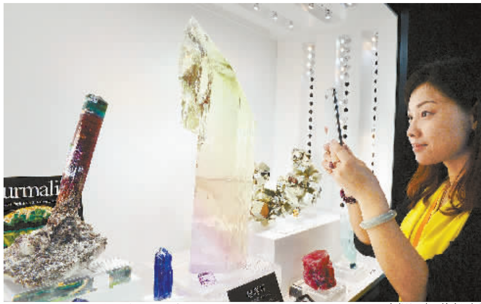
5月15日,市民在矿博会现场参观拍照。

省政府秘书长戴道晋,以及来自国内外矿物宝石行业的专家学者、展商代表等参加开幕式。