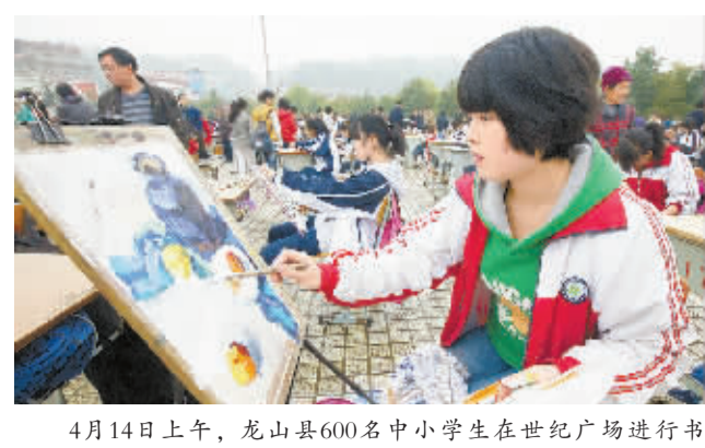
4月14日上午,龙山县600名中小学生在世纪广场进行书法、绘画比赛。

交通一发达,世界就变小。武广高铁与广深高铁贯通,从长沙到深圳仅需3小时。流金淌银的港、澳也在挥手之间,高铁已深刻地改变我们的生活——