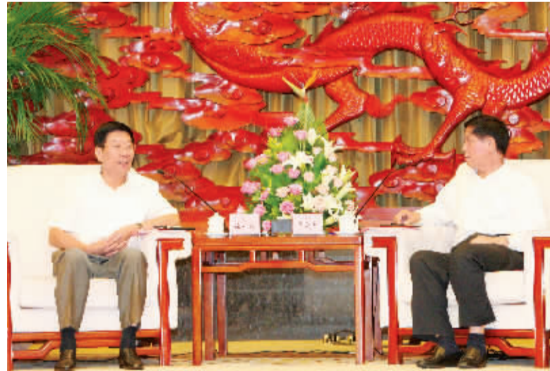
8月18日,栗战书等在贵阳市会见徐守盛一行。本报记者 罗新国 摄