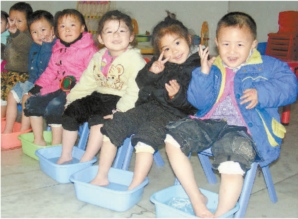
2月26日,怀化市鹤城区金山幼稚园中班新生在接受入园第一课教育——“学穿鞋子、自己洗脚”。当天,该园针对不同年龄的小朋友,安排主题为“遵守秩序,学会自理”的开学教育课,提高孩子们适应集体生活的能力。

2009年,为克服国际金融危机带来的不利影响,炎陵县对全县工业企业实施“特别保护”。同时,为企业提供电价优惠、信贷支持、财税返还等。通过一系列政策支持,2009年全县实现工业总产值27.5亿元、GDP22.7亿元、财政收入2.606亿元,分别比上年增长25.8%、16.8%、27%,被评为全省“县域经济发展先进县”。