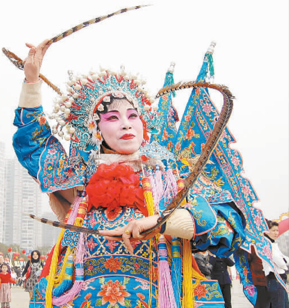
2月28日,永州市人民政府在滨江广场举办2010年元宵大型灯会活动,精彩的地方戏曲表演为灯会增添了一道亮丽风景。