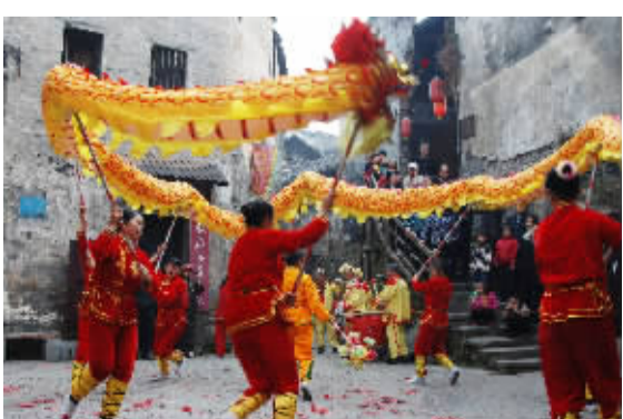
2月28日元宵节,怀化市洪江古商城内龙腾狮舞,30多条大小龙灯穿梭于小巷,热闹非凡。