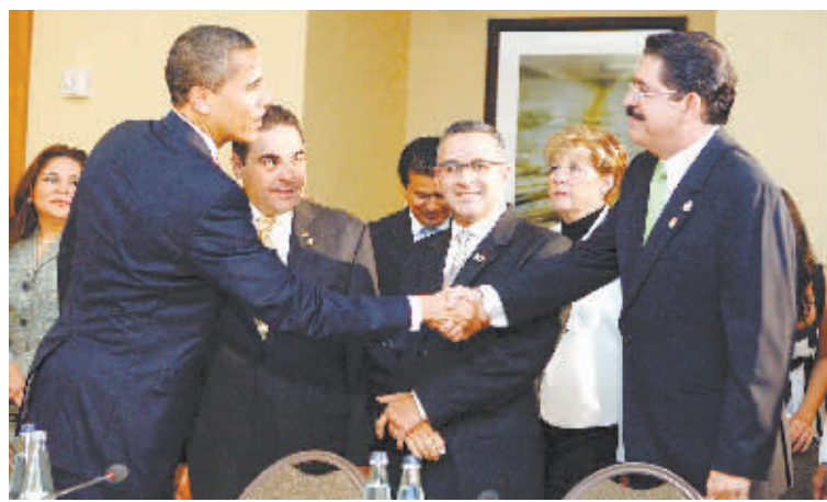
4月19日,在特立尼达和多巴哥首都西班牙港,美国总统奥巴马(左)与洪都拉斯总统塞拉亚交谈。