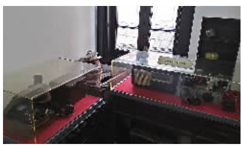
李白生前使用过的电台及发报机。存于上海的李白烈士故居。