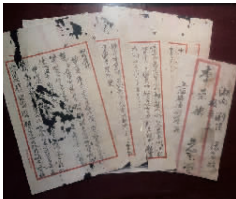
李白写给父亲的家书。原件存于中共一大纪念馆，图为浏阳李白烈士故居展出的复制件。