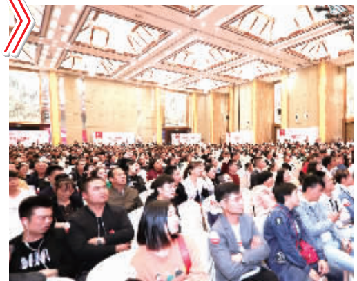
活动现场座无虚席。