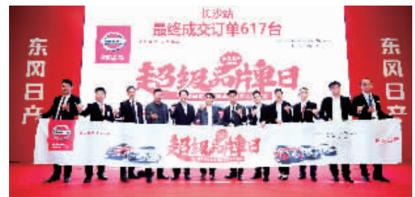
东风日产“超级品牌日”长沙站斩获订单617台。

进入11月,各大汽车品牌纷纷启动年末冲刺。东风日产华中二区营销中心相关负责人也向记者表示,在2019年的最后一个季度,东风日产将依旧保持冲劲,全力冲刺年度目标。(刘宇慧)