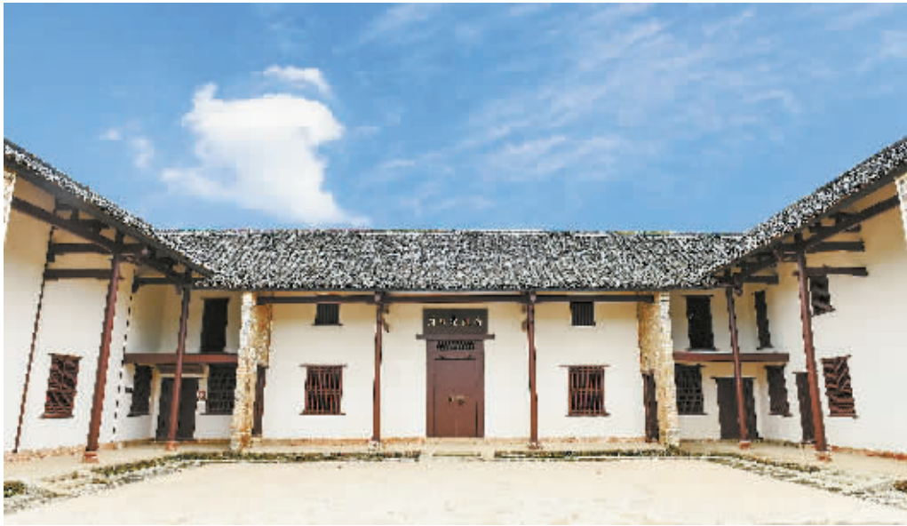
2018年4月14日，衡阳县洪市镇明翰村，夏明翰故居。

大众投票通道为湖南省文化和旅游厅官方网站、“文旅湖南”微信公众号、时刻新闻客户端、红网。