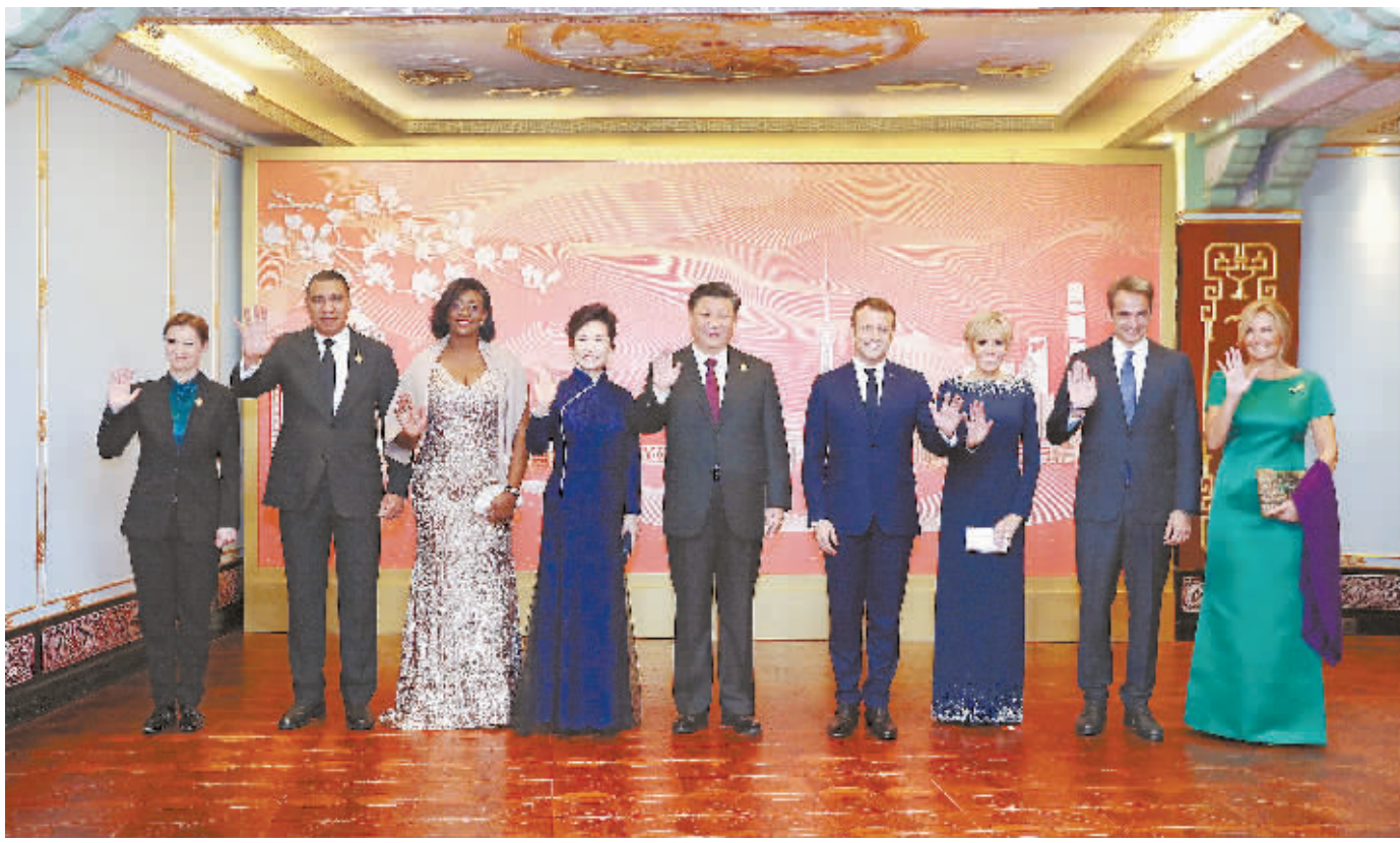
11月4日晚,国家主席习近平和夫人彭丽媛在上海和平饭店举行宴会,欢迎出席第二届中国国际进口博览会的各国贵宾。这是宴会前,习近平和彭丽媛同法国总统马克龙夫妇、牙买加总理霍尔尼斯夫妇、希腊总理米佐塔基斯夫妇、塞尔维亚总理布尔纳比奇等外方贵宾合影留念。

新华社上海11月4日电 国家主席习近平和夫人彭丽媛4日晚在上海和平饭店举行宴会,欢迎出席第二届中国国际进口博览会的各国贵宾。