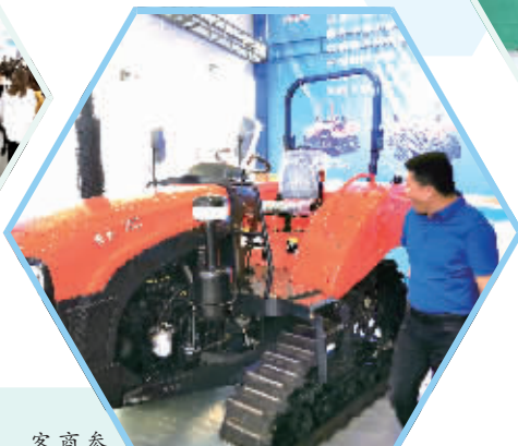
客商参观农夫履带式拖拉机。