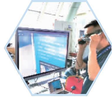
客商体验智能+5G互联工厂中,AR眼镜运用的场景。