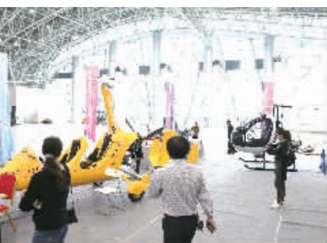
客商、市民参观湘展通用航空的旋翼机。

这次工业产品展销对接活动旨在通过搭建一个展示名品、推荐名企、邀请客商、产销对接的平台,对郴州市优秀工业产品进行展示,对郴州市优秀企业和企业家进行推介,力求帮助企业畅通信息交流渠道,扩大销售、拓展市场。活动在郴州国际会展中心设置了有色稀贵金属、建材及新材料、电子信息、机械装备、食品轻工、移动互联网和大数据产业等6大板块,展位面积2万余平方米,集中展出郴州工业“名、优、特、新”产品和服务。