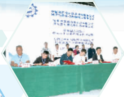
10月12日,合作协议集中签约。