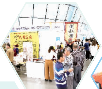
客商、市民踊跃选购产品。