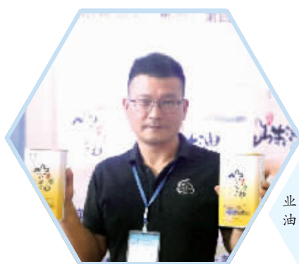
皓翔农业生产的茶油。