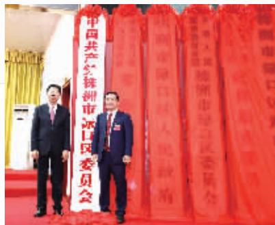
撤县设区揭牌仪式