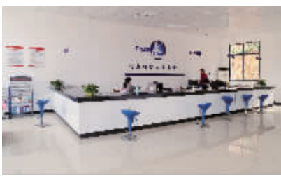
规范化村级综合服务平台