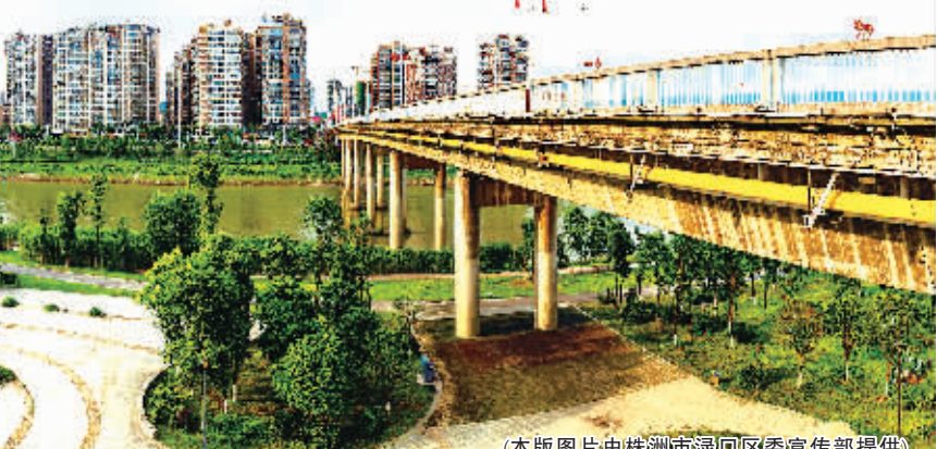
(本版图片由株洲市渌口区委宣传部提供)