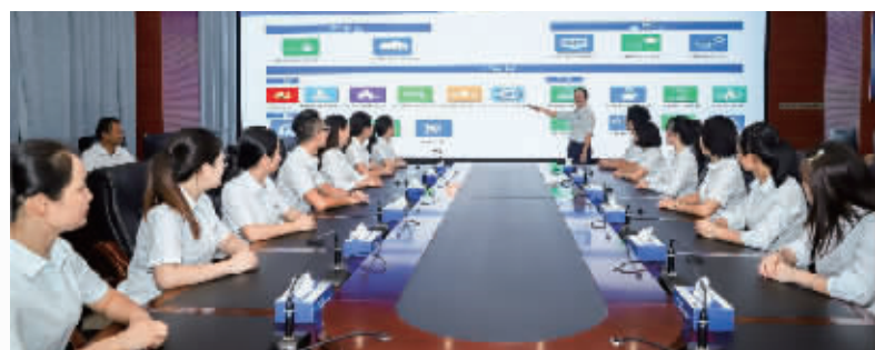
网格化管理服务中心