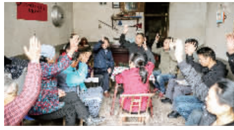
龙门镇花冲村“脱贫立志、星级创建”村组评议会

近年来,该区财政投入5000多万元,按照“统一标识、统一外观、统一机构牌、统一服务