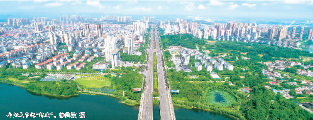
岳阳城景起“新城”。