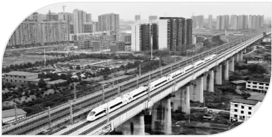
穿越邵阳城区的动车。