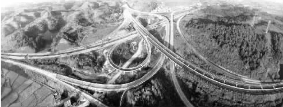
高速公路交错的邵阳柘木山互通。