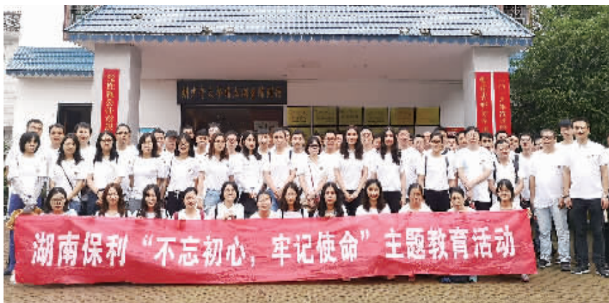
湖南保利“不忘初心，牢记使命”主题教育活动现场留影

为认真贯彻落实党中央关于开展“不忘初心、牢记使命”主题教育的指示精神，根据中央保利集团党委《关于开展“不忘初心、牢记使命”主题教育的实施方案》要求，湖南保利从2019年6月开始至8月底，已开展为