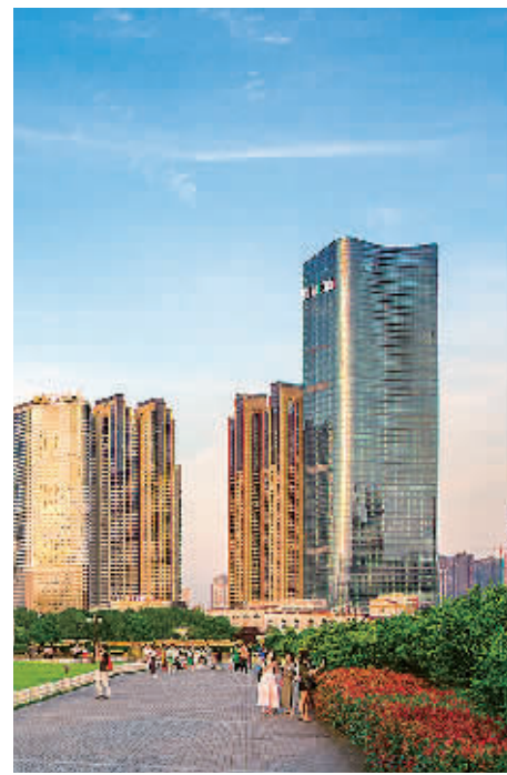
保利国际广场项目

同时，在保利发展每年9月推出的“公益月”，以及每年10月17日的国家扶贫日，湖南保利在党员、团员的带头作用下，全体员工积极捐书捐物，以实际行动扶贫助困。保利发展湖南公司相关负责人表示，希望通过这种公益活动，将公司党员、员工、业主和社会大众善心善举聚小成多，唤醒整个社会的公益意识，提高企业的社会公信力和影响力。这也是对保利“和者筑善”文化理念的最佳诠释和实践。