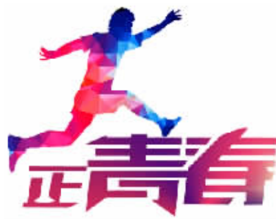
湖南日报记者 陈鸿飞 见习记者 王梅 通讯员 谭懿

随后，大通湖区纪委区监察工委对周、姚案件背后存在的贪腐和失职渎职问题进行清查。今年7月，原人社局分管副局长、二级机构负责人等8名相关人员被立案调查。