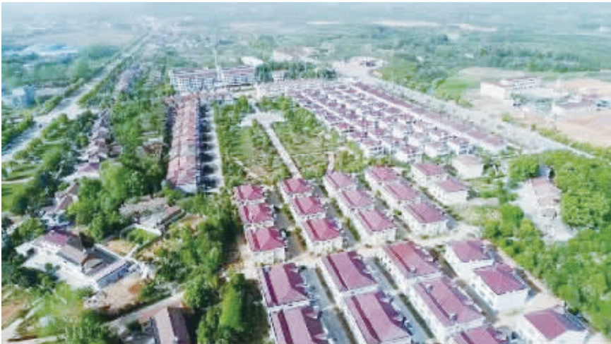
临澧县太平街道太平社区环境美如画。

位需求,更注重挖掘资源禀赋、文化底蕴,彰显村庄特色。实行开门编规划,规划内容三次公示征求群众意见,确保规划接地气、能执行。目前,该县已完成10个中心村的村庄建设规划编制,力争年内完成63个村的村庄建设规划编制任务。