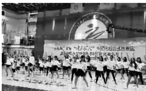
首届“健康湖南”全民运动会郴州赛区选拔赛