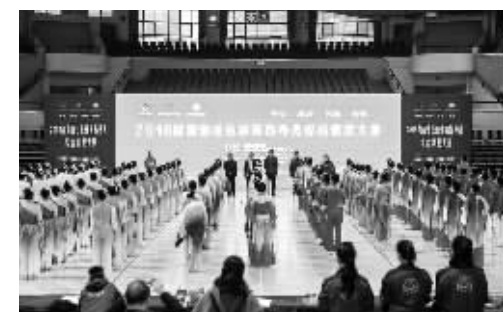
湖南省社会体育指导员综合素质大赛