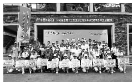
“体彩杯”湖南省第十三届运动会高尔夫球青少年组比赛

过的路、徒步穿越大湘西、大湘南”活动、“巅峰湖南·2018”六大名山连登积分联赛,2018年中国山地户外健身休闲大会、人民足球嘉年华活动等一大批社会影响大、群众关注和参与度高的具有湖湘特色的全民健身赛事活动,真正实现了全民健身全覆盖。二是推进健身设施建设,场馆免费低收费开放。2018年,共投入7488万元建设体育大型场