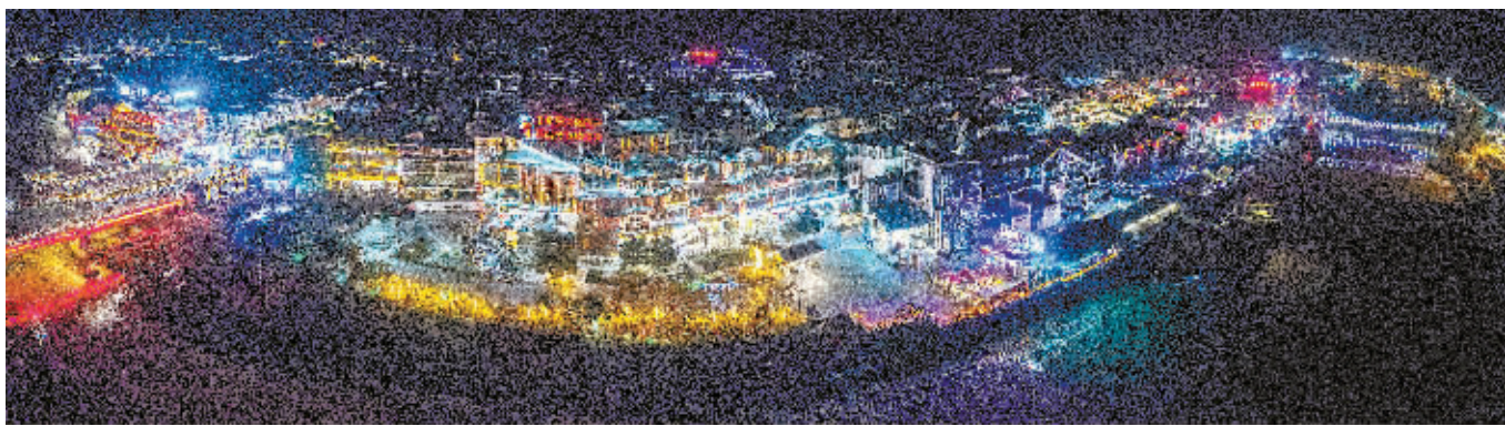
不夜天溪布街(铜奖)