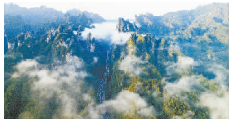
秘境武陵山大道(银奖)