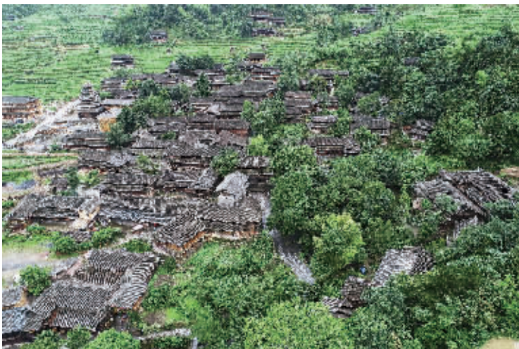
6月27日，航拍的绥宁县寨市苗族侗族乡上堡村。