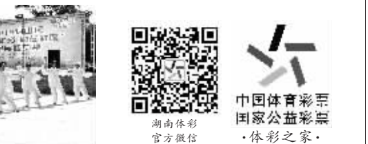
中国体育彩票 国家公益彩票 · 体彩之家