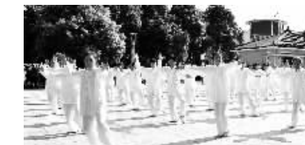
2019君山区“公益体彩 赢在社区”全民健身赛活动现场。

益公信责任彩票形象。“公益体彩 赢在社区”全民健身活动是湖南省体彩中心的品牌活动之一。近年来,君山区体彩事业筹集体彩公益金2000多万元,被广泛用于君山区各个乡镇、社区的全民健身设施建设。(刘浩 刘其佳)