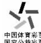
湖南体彩官方微信 中国体育彩票 国家公共彩票 体彩之家