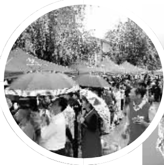
“体彩嘉年华”活动现场

公益体彩，乐善人生。购彩者每购买一张3元的体彩大乐透追加票，就有1.08元资金成为公益金，将为社会公益事业和体育事业的发展贡献一份力量。今年是中国体育彩票全国统一发行25周年，截至2019年6月2日，历年来累计筹集公益金已达4804.36亿元，本年度筹集公益金已达241.12亿元。感谢每一位购彩者的支持，中国体育彩票将让更多快乐与美好发生。(孙涛)