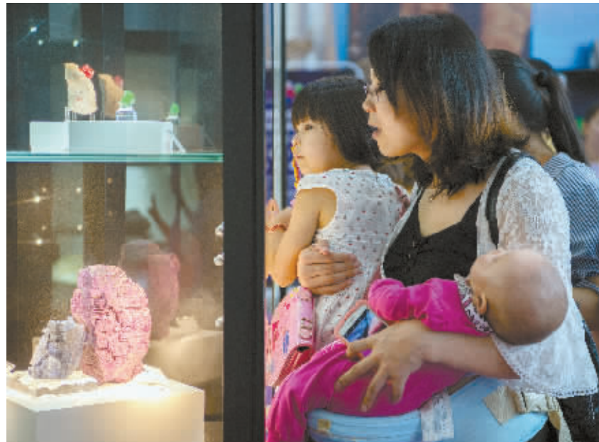
5月18日,郴州国际会展中心,第七届中国(湖南)国际矿物宝石博览会现场,市民带着小朋友前来参观。