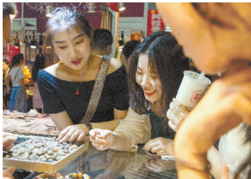
5月18日,郴州国际会展中心,第七届中国(湖南)国际矿物宝石博览会现场,市民在挑选商品。