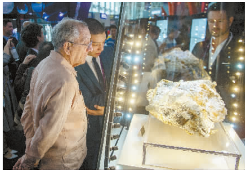
5月17日,郴州国际会展中心,第七届中国(湖南)国际矿物宝石博览会上,观众在欣赏来自澳大利亚的目前世界最大自然金。