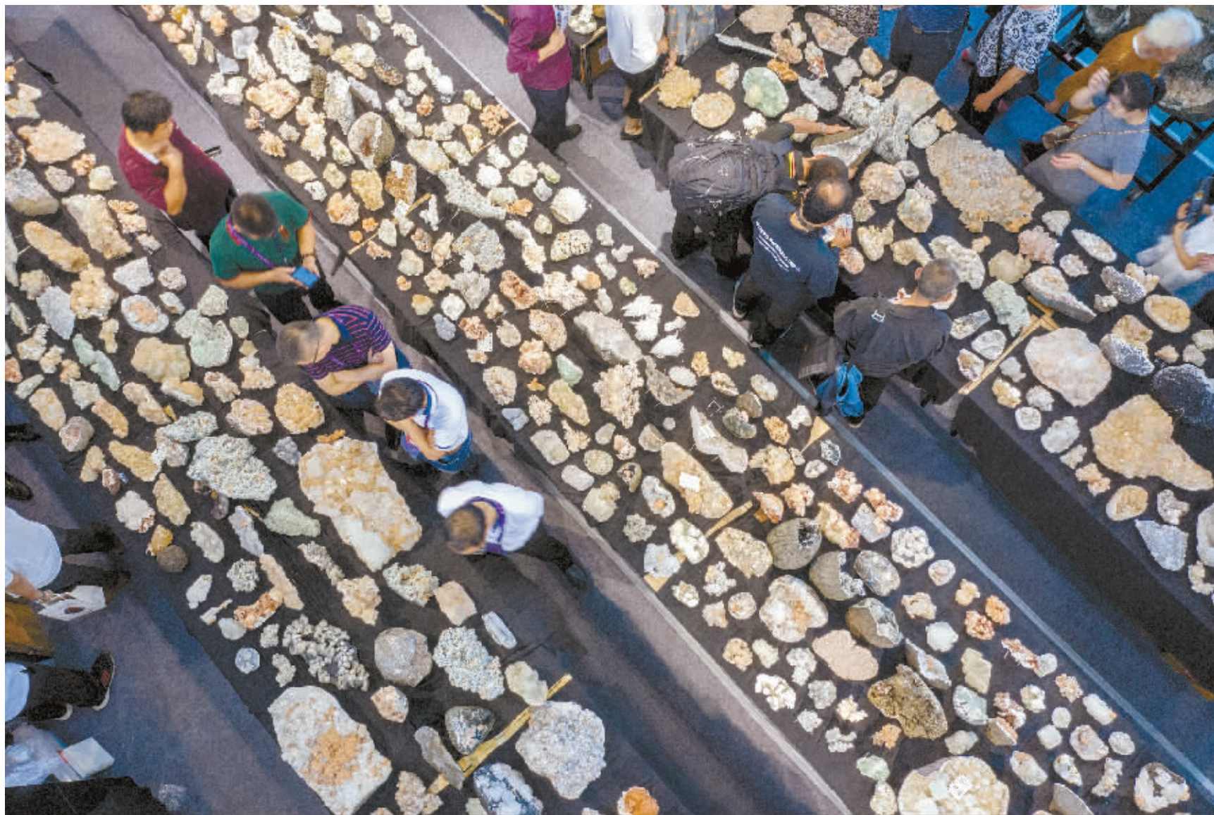
5月18日,郴州国际会展中心,第七届中国(湖南)国际矿物宝石博览会现场,市民在挑选商品。