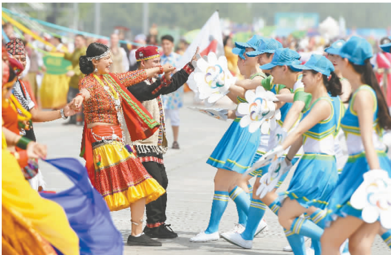
5月16日，来自尼泊尔的艺术工作者在巡游表演中与中国表演者互动。