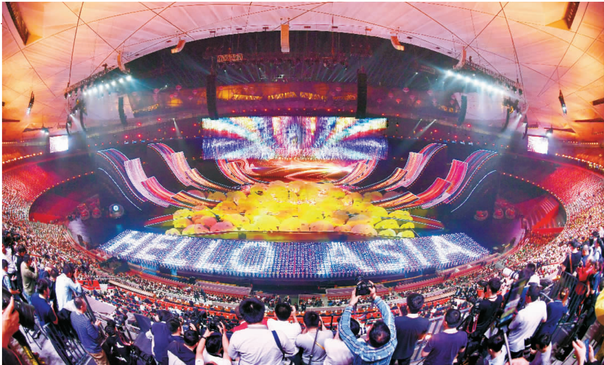
5月15日晚，“亚洲文化嘉年华”在北京国家体育场“鸟巢”举行。