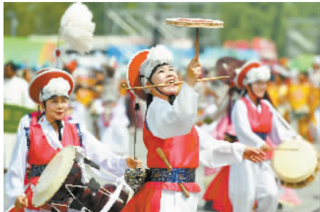
5月16日，来自韩国的艺术工作者在进行巡游表演。