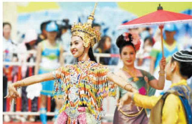
5月16日，来自泰国的艺术工作者在进行巡游表演。当天，亚洲文明巡游活动和亚洲美食节在北京奥林匹克公园开幕。