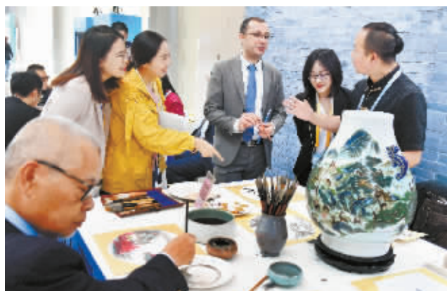
5月15日，外国媒体记者在非遗互动区体验中国画。