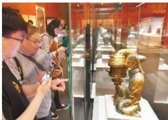
5月16日，中国国家博物馆，来宾在参观《大美亚细亚——亚洲文明展》展出的中国国宝长信宫灯。

“一花独放不是春，百花齐放春满园。”今天的亚洲，文化多样性的特点十分突出，在平等、包容的语境下，在多样共存的共识中推动文明交流互鉴，将进一步彰显文明的生命力，让文明之花更加璀璨绽放。