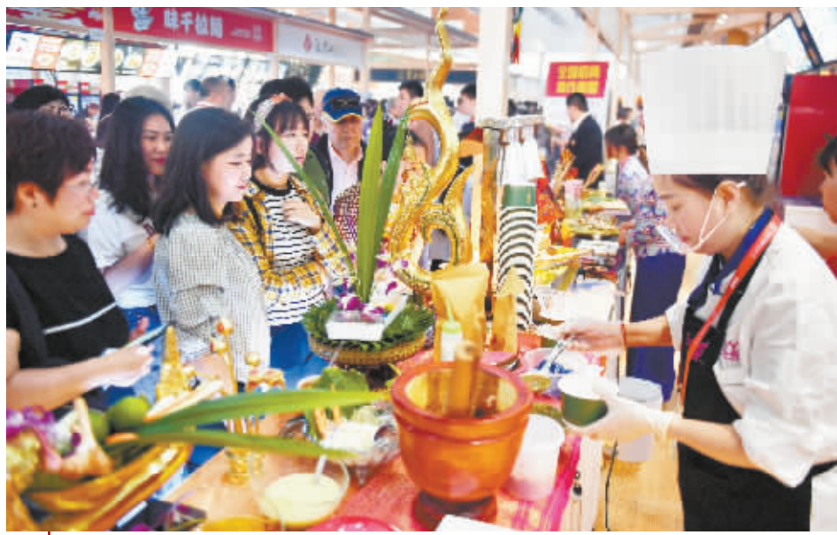
5月16日，来宾、市民在亚洲美食节上品尝美食。