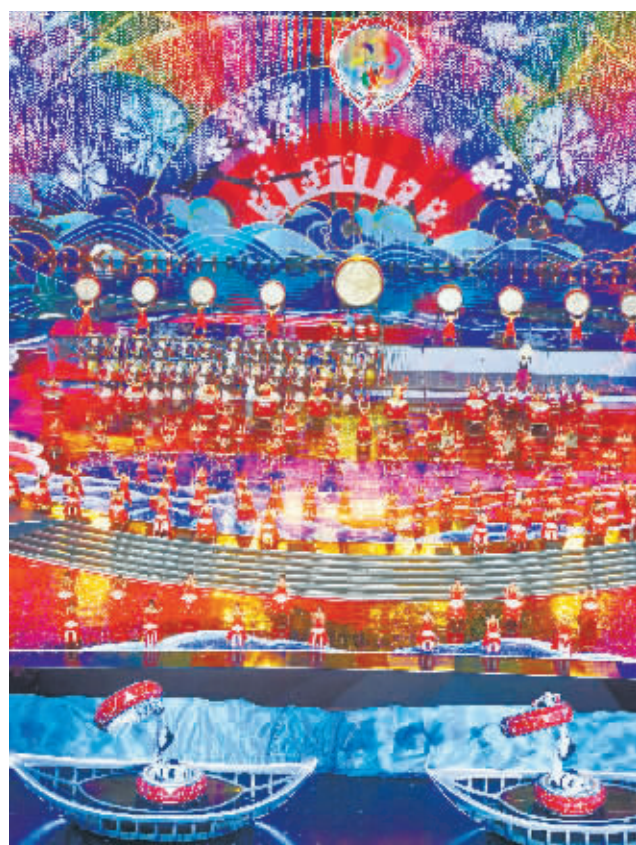
5月15日晚，来自亚洲各国的演员表演各具特色的歌舞节目，呈现出了一出多姿多彩的亚洲风情大联欢。