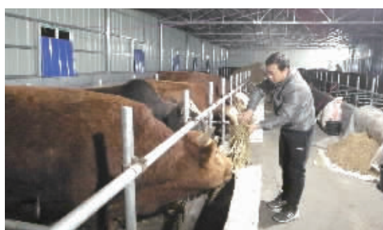
中信银行长沙分行在泸溪县白羊溪乡云上村倾力实施产业脱贫工程,新建了400平方米的标准化黄牛养殖基地。