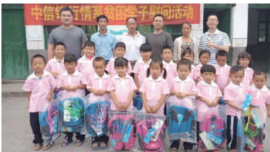
中信银行长沙分行慰问泸溪县白羊溪乡云上村贫困学子,送去新校服、书包和文体用品。

目前,该项目已作为经典扶贫案例,由国家民族事务委员会和中央民族大学申报了中国国际扶贫中心组织的“全球减贫案例”项目。