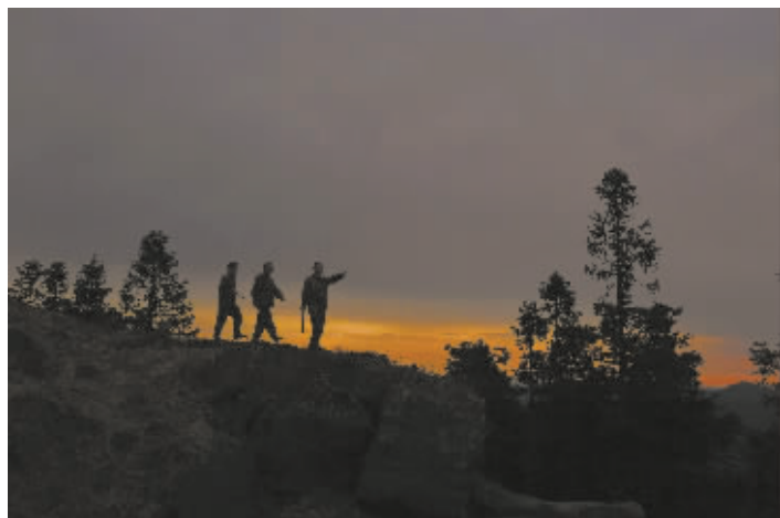
3月15日清晨,3名护林员迎着日出巡山。