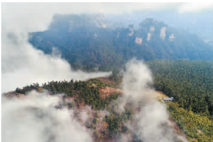
3月14日上午,俯瞰张家界武陵源风景名胜区和国家森林公园管理局资源保护科朝天观护林点,云雾缭绕的武陵源峰林,壮美如画。